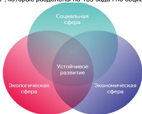
Рис.2 Триединый принцип достижения целей ЦУР в соответствии с Концепцией ООН [4].

193 страны, включая Россию, приняли на себя добровольное обязательство реализовывать 17 ЦУР, которые разделены на 169 задач по социальным, экономическим и экологическим аспектам.